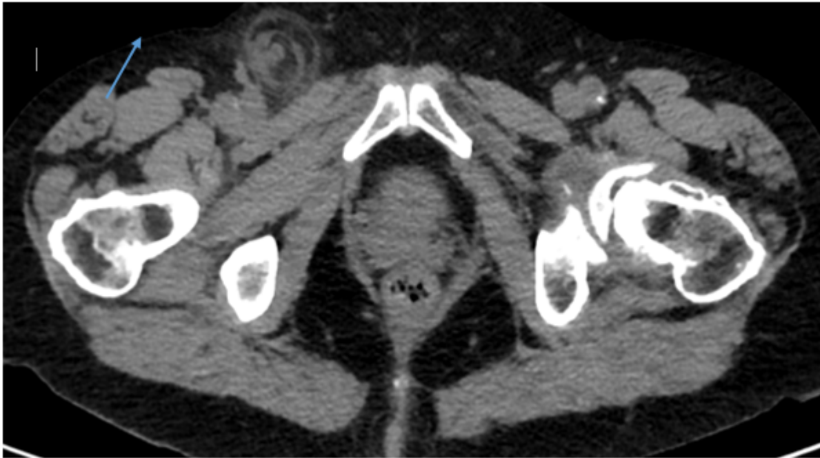
Imagen de TAC donde se aprecia el saco herniario con una estructura tubular en su interior, correspondiente al apéndice cecal (flecha azul).