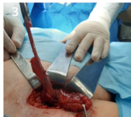
Imágenes de la cirugía donde se muestra la disección del saco herniario (1), así como la extracción del apéndice cecal del interior del saco (2 y 3).