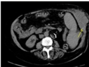
Figura 2. TAC con absceso en pared antero-lateral izquierda. Flecha: pequeño nódulo hiperdenso que podría corresponder a coledocitis derramada y migrada.