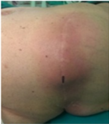
Figura 1. Tumoración y eritema en cicatriz de nefrectomía izquierda. La zona de mayor fluctuación está marcada con rotulador.