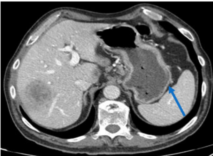
TAC de control donde se evidencia disminución significativa de la neumatosis vista al diagnóstico (flecha azul).

Discusión: El enfisema gástrico constituye una entidad infrecuente que puede desencadenarse por muy diversas causas, entre las que se incluyen la emesis brusca, la aerofagia o la obstrucción pilórica o duodenal (en el contexto de úlceras duodenales o del vólvulo gástrico). También existen casos reconocidos derivados de ruptura de una bulla al mediastino o de traumatismos por sonda nasogástrica. Es más frecuente en niños y adultos caquéticos, que suelen debutar con cuadros de distensión gástrica y vómitos o tos incoercible. El TAC abdominal es el método de elección en su detección. La imagen característica consiste en la presencia de bandas lineales de aire paralelas a las paredes del estómago. Este cuadro suele tener una resolución espontánea. El manejo mediante reposo digestivo y observación es el recomendado en la mayoría de los casos.