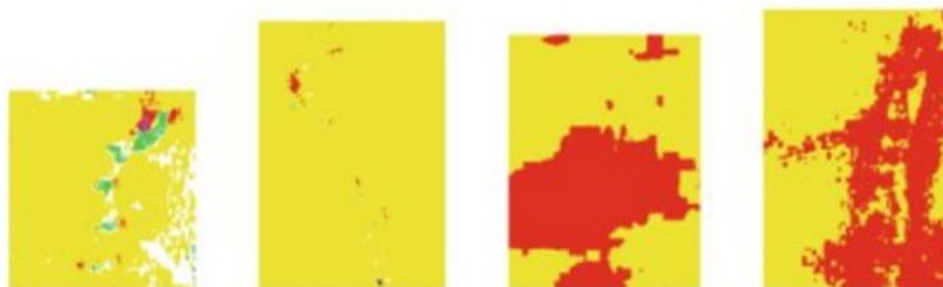
Figura 2. Segmentación de imágenes con difusión de colores obtenidas tras el primer análisis. Como se puede ver, en esta imagen etiquetada como herida infectada, hay grandes áreas con una alta presencia de color rojo.

Conclusiones: Nuestros resultados muestran que en heridas con diagnóstico de infección postoperatoria, la proporción de píxeles etiquetados como rojos es mayor del 40%, porcentaje mucho mayor que en aquellas imágenes catalogadas como heridas no infectadas. Estos primeros resultados, aunque prometedores, necesitan consolidarse con una muestra más grande, comparando los resultados obtenidos a través de la app con el diagnóstico clínico presencial.