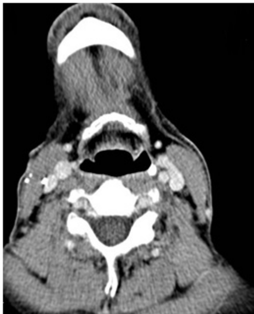
Figura 2. AngioTC cervical. Corte axial en lado izquierdo y su reconstrucción en 3D en lado derecho donde se demuestra cambios posquirúrgicos en carótida común derecha.

Figura 1. Angiografía de troncos supraaórticos con RM: Masa cervical con componente hemático laterocervical derecho, adyacente a la zona distal de la carótida común, compatible con pseudoaneurisma. Se evidencia una estenosis no significativa de la carótida común.