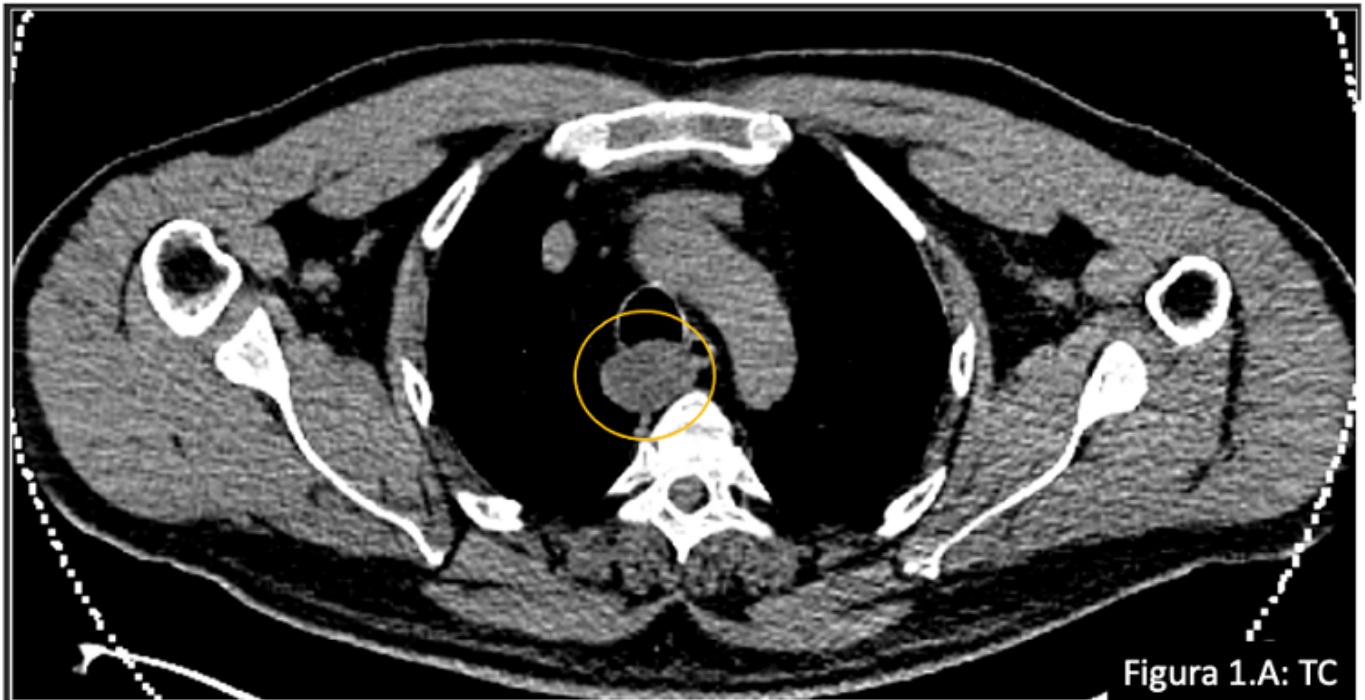
Figura 1.A: TC