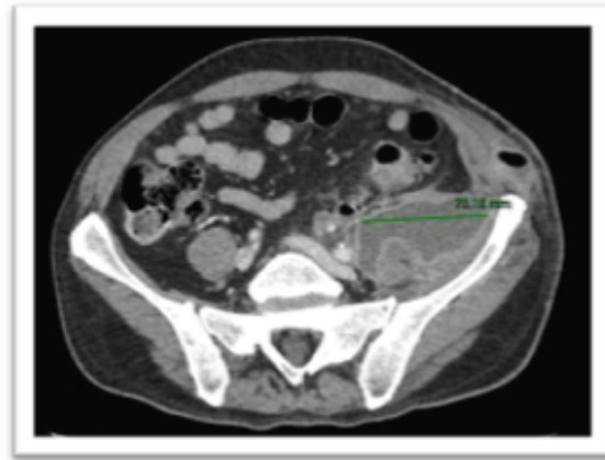
Fig. 1b TAC ABD

Fig. 1a y 1b TAC abdomen: Colección de 13 cm de diámetro craneocaudal, 11,4 cm de diámetro AP y 7 cm de diámetro transversal con nivel hidroaéreo compatible con absceso que afecta al psoas ilíaco izquierdo y se extiende a la musculatura y al tejido celular de la región inguinal izquierda. (línea verde) Engrosamiento parietal de colon sigmoide, con divertículos, apreciándose un trayecto fistuloso (flecha roja) desde uno de ellos hacia el absceso.