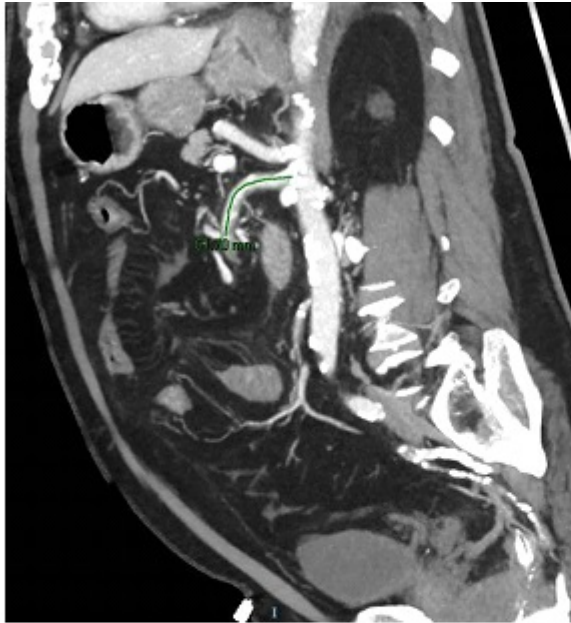
TC de abdomen al ingreso