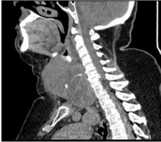
FOTO: TAC cervical que muestra masa tiroidea con compresión traqueal

Conclusiones: El CEPT es una patología rara, agresiva a nivel local, con rápida evolución y con diagnóstico casi siempre fuera de plazo para una cirugía R0. El diagnóstico es anatomopatológico, y puede comportar dificultades. Se debe descartar siempre que no se trate de una metástasis con un estudio de extensión completo. Debemos pensar en esta entidad en masas de crecimiento rápido pues esto agiliza el diagnóstico y puede condicionar un tratamiento sintomático precoz.