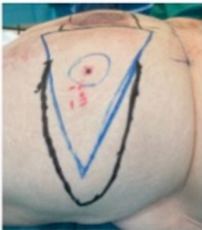
Colgajo SGAP: Trazado en color azul y negro Arteria perforante: Punto negro