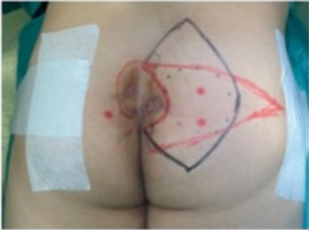
Colgajo Keystone: Trazado en color negro Colgajo SGAP: Trazado en color rojo