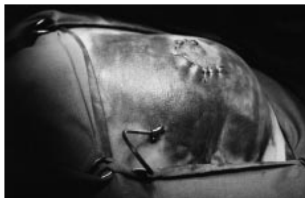
Fig. 1. Gran hematoma después de una pequeña intervención. El dren no funcionó.

En lo que a la linfadenectomía axilar se refiere, y máxime en la cirugía conservadora, que se realiza a través de incisiones muy pequeñas, el cirujano debe ser un experto en este tipo de intervenciones, en las que se ha de disecar la vena axilar hasta el vértice y su entrada en el tórax. La hemostasia en cada paso debe ser meticulosa, para poder ver y no actuar nunca a ciegas. Una