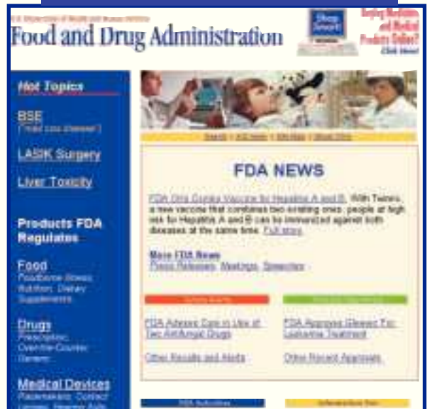
Enlace: web de la FDA