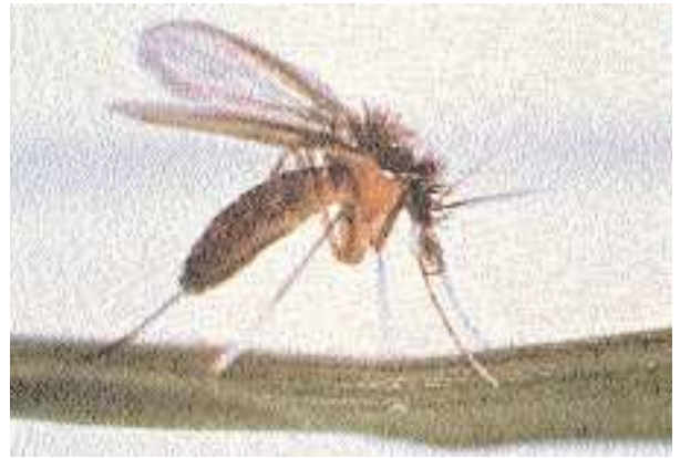
Fig. 1. Hembra del mosquito Phlebotomus , vector de la leishmaniasis.

Los reservorios primarios usualmente son mamíferos silvestres, que generalmente no muestran signos eviden-