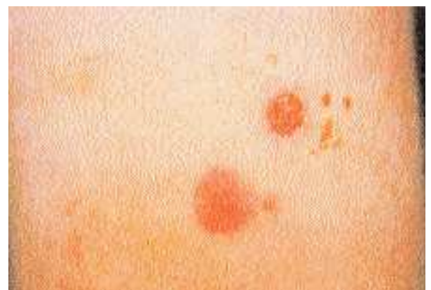
Fig. 3. Lesiones cutáneas en distintos estadios, producidas por Leishmania braziliensis .

Las lesiones suelen iniciarse en el tabique nasal y posteriormente se extienden a las mucosas de la orofaringe, paladar y úvula, laringe e, incluso, pueden afectar a las cuerdas vocales y tráquea. Algunas de estas lesiones pueden evolucionar a ulceraciones y en casos avanzados se puede observar amputación del tabique nasal