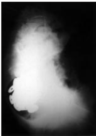
Figura 1. Cuerpo extraño en recto.

La paciente fue ingresada para el estudio y tratamiento de la anemia. La fibrogastroscoopia objetivó un cráter ulceroso de 0,5 cm de diámetro en la curvatura menor sin evidencias de malignidad en la biopsia, y en la fibrocolonoscopia realizada se hallaron prolapso e inflamación de la mucosa rectal