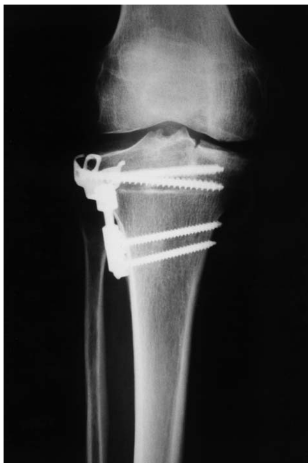
Figura 4. Fractura de platillo tibial interno por osteotomía insuficiente. A pesar de la corrección del varo obtenida la evolución clínica no fue satisfactoria.

un deterioro constante de los resultados, directamente relacionados con la evolución de la enfermedad artrósica 8 . Se aprecian, además, peores resultados a corto plazo en aquellos pacientes con sobrepeso, intervenidos en fases avanzadas de su gonartrosis, y en aquellos en quienes la corrección fue insuficiente. Todo ello sugiere que los resultados a largo plazo se benefician únicamente de una cuidadosa selección de los pacientes y de una técnica quirúrgica precisa 2,8-11 .