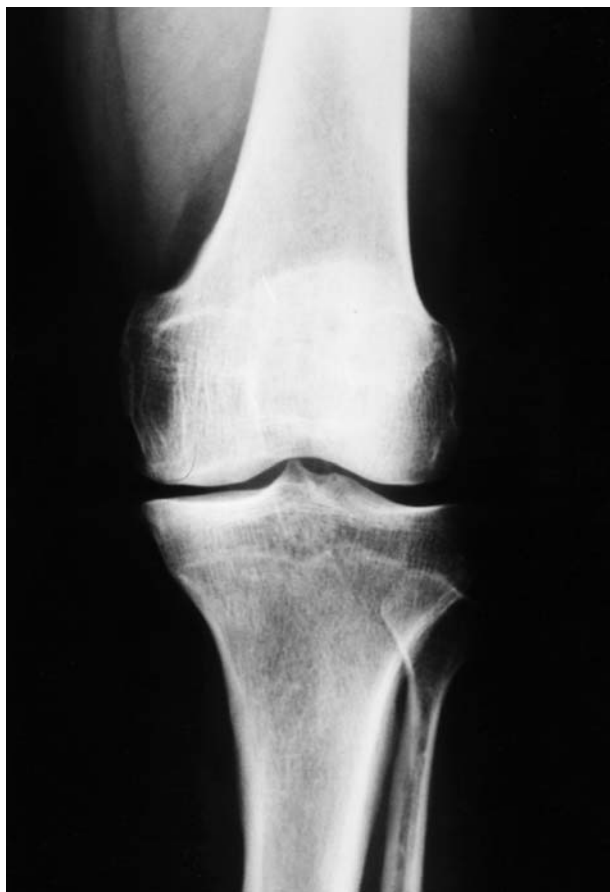
Figura 2. Genu varo artrósico en un varón de 47 años con afectación moderada del compartimento interno.

La consolidación de la osteotomía tibial se logró a las 9,7 +/- 1,25 semanas (mínimo: 8; máximo: 12) (figs. 2 y 3). En el postoperatorio inmediato se presentaron 6 complicaciones. En 4 pacientes existió una paresia transitoria del ciático poplíteo externo que se recuperó en todos ellos a las 9 semanas de media. Hubo un caso de infección superficial, que curó con tratamiento antibiótico oral y curas tópicas; y un caso de fractura de platillo tibial interno por osteotomía insuficiente, que condicionó un mal resultado (fig. 4).