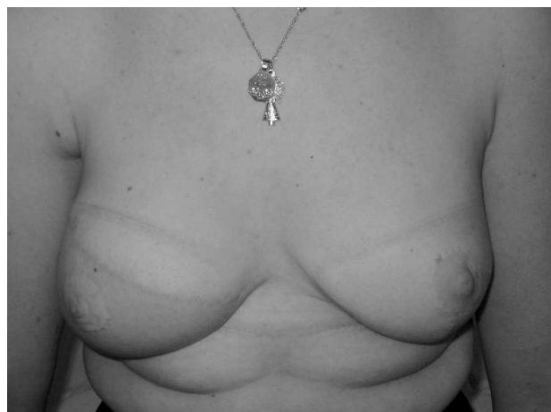
Fig. 3. Aspecto final de la paciente a los 3 meses de la mastectomía profiláctica.