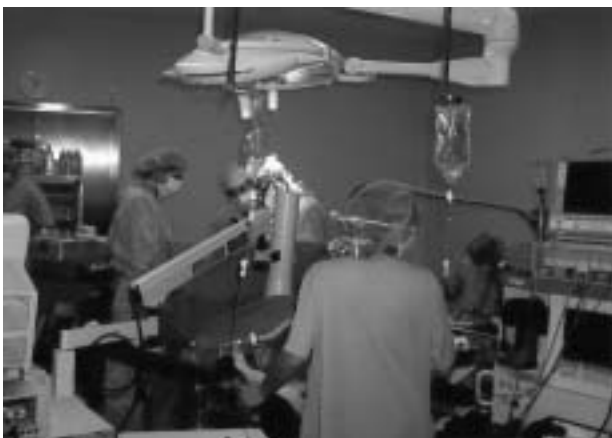
Figura 2. Cirugía de perfusión de extremidad aislada. Monitorización de fuga sistémica de fármacos mediante sonda gammagráfica portátil, situada a nivel precordial.

Transcurridas 4-8 semanas de la PEA, comprobado en los estudios evolutivos que el tumor ha remitido en tamaño y ya no infiltra estructuras cruciales para el mantenimiento de la función de la extremidad, se realiza en un segundo tiempo la exéresis quirúrgica del tumor residual, conservando la extremidad y su función, lo cual redundará en la calidad de vida del paciente.