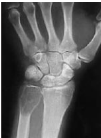
FIGURA 1. Tumor de células gigantes.

Palabras clave: Tumor óseo. Atención primaria. Tumor de células gigantes.