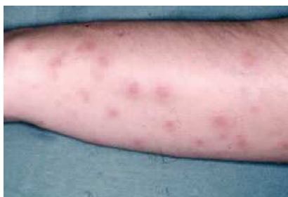
Fig. 2. Escabiosis: erupción en la cara interna del antebrazo

las líneas descamativas finas en forma de lápiz sobre la piel y las excoriaciones y/o lesiones de rascado.