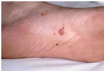
Fig. 1. Escabiosis: erupción en la planta del pie

contagia fácilmente en guarderías y hogares de cuidado diario, colegios, cuarteles, etc. Por este mecanismo de transmisión, la sarna es más frecuente en personas que tienen contacto físico directo regular con otras personas, sobre todo niños, madres con hijos pequeños, adultos sexualmente activos y personas de edad avanzada que viven en hogares para ancianos.