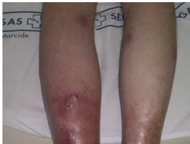
Fig. 1. Nódulos eritematosos localizados en cara posterior de ambas piernas.

En la exploración se observaron nódulos eritematosos, dolorosos a la palpación, localizados en las caras posteriores de ambas piernas y acompañados de edema (fig. 1). El estudio histopatológico de uno de los nódulos de la pierna izquierda mostró una paniculitis lobulillar con necrosis focal de la grasa hipodérmica. Se estableció el diagnóstico de paniculitis pancreática y se realizaron distintas pruebas complementarias ante la sospecha de recidiva del carcinoma pancreático. La ecogra-