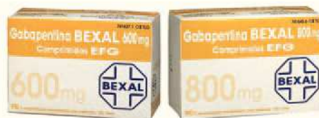
Presentación - Gabapentina Bexal 600 mg EFG. Envase de 90 comprimidos recubiertos. CN 741637. 71,11 €. - Gabapentina Bexal 800 mg EFG. Envase de 90 comprimidos recubiertos. CN 741645. 87,40 €.

B exal Farmacéutica, laboratorio especializado en el desarrollo y comercialización de especialidades farmacéuticas genéricas (EFG), lanza al mercado Gabapentina Bexal 600 y 800 mg EFG . Se trata de un antiepiléptico indicado como monoterapia o terapia combinada en crisis parciales o crisis parciales secundariamente generalizadas. También está indicada en el tratamiento de dolor neuropático. Con estas dos nuevas presentaciones, Bexal completa la gama de presentaciones de gabapentina existentes en el mercado.