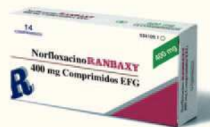
Presentación - Norfloxacin Ranbaxy EFG 400 mg. Envase de 14 comprimidos. CN 934109.1. 6,85 €.

L lega a las farmacias el nuevo Norfloxacino Ranbaxy EFG , indicado para el tratamiento de las infecciones del tracto urinario superior e inferior, incluyendo cistitis, pielitis, cistopielitis y pielonefritis, causadas por bacterias sensibles a este fármaco. Norfloxacino presenta un amplio espectro de actividad antibacteriana frente a gérmenes patógenos aerobios grampositivos y gramnegativos, actúa inhibiendo la síntesis bacteriana del ácido desoxirribonucleico y es bactericida.