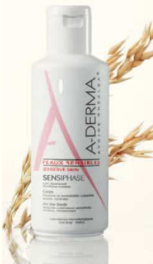
Presentación - Sensiphase Leche Corporal. Frasco de 200 ml. CN 160526.9.

Las cualidades cosméticas también se han tenido en cuenta, pues Sensiphase Leche Corporal hidrata y nutre delicadamente la piel, envolviéndola de manera duradera de suavidad y bienestar. La piel se destensa día tras día, se vuelve flexible y más resistente frente a las agresiones diarias.