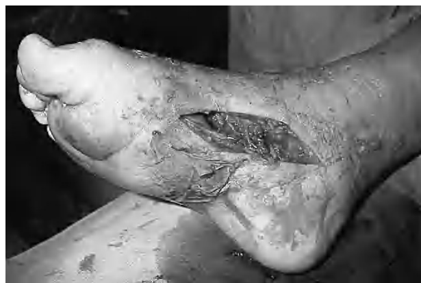
Figura 2. Abordaje medial de la fasciotomía e imagen clínica del hemangioma en la cara plantar.