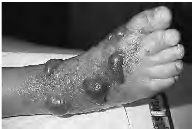
Figura 1. Imagen clínica del pie con flictenas y hemangioma en el segundo dedo.

Meses después de resuelto el problema agudo se realizó estudio de resonancia magnética del pie afecto para valorar