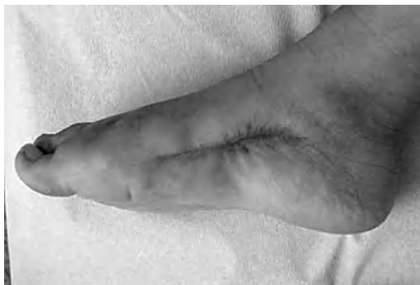
Figura 4. Aspecto clínico del pie en la última visita a consultas externas: (A) imagen superior; (B) vista lateral.

más habituales en adultos y se localizan en el miembro superior 3,4,7,11 . En nuestro caso no solicitamos niveles de antígeno pero sí cursamos hemocultivos y cultivos de la herida durante el proceso que fueron continuamente negativos. Desai informó sobre un caso de SC sin traumatismo previo en un paciente con una trombocitopenia inducida por el virus de la inmunodeficiencia humana (VIH) y afirma que el SC es una complicación infrecuente en las alteraciones plaquetarias 3 . Además, los hemangiomas pueden causar coagulopatías en su evolución 9 . Existen varios estudios que describen SC causados por infecciones; en un caso, el SC fue el síntoma inicial de una sepsis por Vibrio vulnificus 4 ; en otro, una infección por varicela causó un tromboembolismo que desencadenó un SC en un niño de 18 meses de edad 11 ; y en otro caso el SC fue el desenlace final de una rabdomiólisis inducida por una infección por virus influenza A 6 . En este último caso, los cultivos del tejido y los hemocultivos fueron negativos 6 . El virus de la influenza, el VIH y los enterovirus pueden dar lugar a rabdomiólisis rara vez complicada con SC 6 .