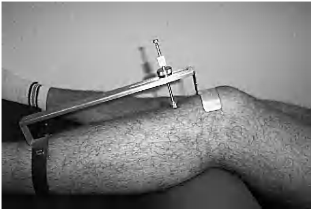
Figura 2. Sistema de medición Rolimeter.

dos últimos. Si la diferencia entre las dos últimas mediciones era mayor de dos milímetros se retiraba el dispositivo de medición y se realizaba de nuevo la secuencia completa 11 .