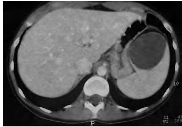
Fig. 1. Tomografía computarizada donde se objetiva un quiste esplénico de 5 x 5 cm que comprime extrínsecamente a estómago, circunstancia que explica la clínica de la paciente.

Dada la alta recidiva en los casos de punción y drenaje percutáneos en los quistes esplénicos 1 , la cirugía es la única opción terapéutica 1,2 . La técnica y el abordaje quirúrgico preferente serán lo más conservador que sea posible, con la finalidad de prevenir las consecuencias inmunitarias de la pérdida total del parénquima esplénico en esta afección benigna: esplenectomía parcial, marsupialización y fenestración, dando preferencia al abordaje laparoscópico. La esplenectomía total quedará reservada únicamente para los quistes de gran tamaño o próximos al hilio esplénico 1 . La fenestración o "destechamiento" del quiste (técnica empleada en nuestro caso) consiste en la aspiración del contenido y resección de una porción de su pared 1,3 (fig. 2). Serán subsidiarios de tratamiento qui-