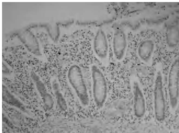
Fig. 2. Estudio inmunohistoquímico para demostración de citomegalovirus: positividad en células endoteliales.

Sin embargo, a las 72 h de su ingreso en planta el paciente sufrió un empeoramiento de su estado general y regresó a la UCI con el diagnóstico de shock séptico. Se solicitó una tomografía computarizada abdominal, en la que apareció neumoperitoneo importante con líquido libre y dilatación de asas intestinales.