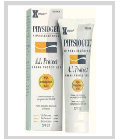
Physiogel A.I. Protect Envase de 50 ml CN 305198.9