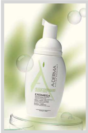
Exomega Champú Espuma Envase dosificador de 125 ml sin gas propulsor CN 311955.9

La marca A-Derma de Pierre Fabre Dermocosmética & Santé lanza el nuevo Exomega Champú Espuma , un producto formulado para limpiar con suavidad el cuero cabelludo especialmente reactivo de los bebés y niños atópicos. Disminuye la sequedad cutánea y el eritema del cuero cabelludo por su acción calmante, frenando el proceso de descamación, y proporciona una total seguridad de utilización, ya que es un producto de alta tolerancia, sin riesgo de irritar el cuero cabelludo y los ojos. Su formato envase-dosificador, práctico y fácil de utilizar, suministra la cantidad necesaria de producto.