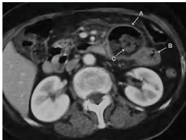
Fig. 2. A: divertículo yeyunal. B: primera asa yeyunal. C: litiasis intradiverticular.