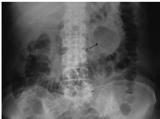
Fig. 1. A: divertículo yeyunal.