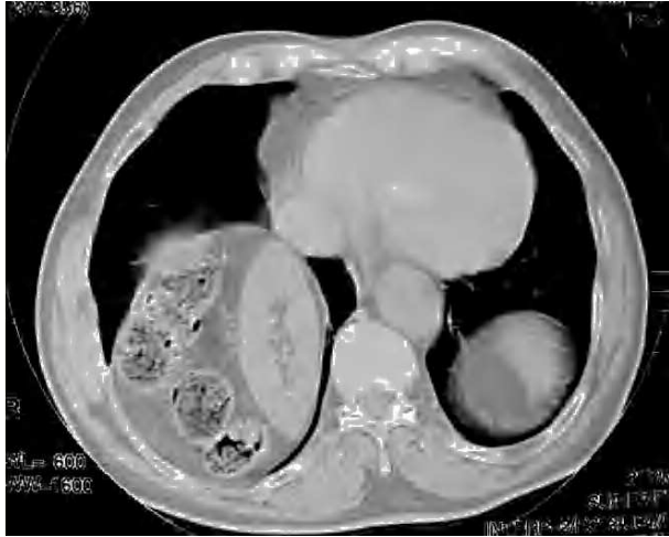
Figura 3. Tomografía axial computarizada toracoabdominal. Hernia derecha con riñón derecho paravertebral horizontalizado acompañado de asas intestinales y grasa mesentérica. Hernia izquierda con ocupación parcial por bazo.