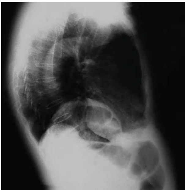
Figura 2. Radiografía lateral de tórax. Doble hernia posterior de diafragma. Se aprecian asas colónicas en el interior de la hernia derecha.

En octubre de 2004 presenta proceso respiratorio febril, con esputo herrumbroso y auscultación con disminución del murmullo vesicular en bases y sibilancias espiratorias.