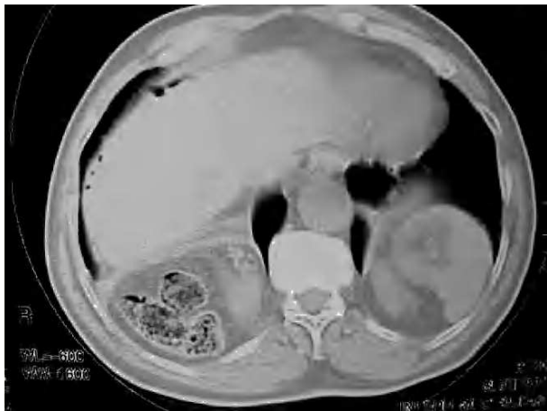
Figura 4. Tomografía axial computarizada toracoabdominal. Hernia derecha con riñón derecho paravertebral horizontalizado acompañado de asas intestinales y grasa mesentérica. Hernia izquierda con ocupación parcial por bazo y polo superior de riñón izquierdo.

La mayoría de las hernias de Bochdalek del adulto cursan de forma asintomática, sobre todo las de pequeño tamaño (lo que a menudo justificaría que en la radiografía simple de tórax sean confundidas con diafragmas bilobulados) 5 , pero en la actualidad la mayor resolución de las técnicas de imagen, como la TAC o la resonancia magnética, y su accesibilidad hacen posible un mayor diagnóstico de forma intencionada (cuando se sospechan) o incidental. En nuestro caso el hallazgo en la Rx simple de tórax de la hernia derecha llevó al estudio con TAC, que documentó su carácter bilateral, aunque éste ya podía sospecharse en la placa de tórax.