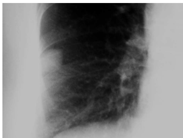
Figura 2. Detalle de radiografía de tórax.

pulmonar normal. Su tamaño debe ser inferior a 3 cm, puesto que por encima de este tamaño tienen una alta posibilidad de ser lesiones malignas. Aproximadamente el 50% de los NPS corresponden a lesiones malignas, de ellas un 70-80% son carcinomas broncogénicos. En cuanto al 50% de los nódulos benignos, la mayoría corresponden a procesos inflamatorios 1,2 .