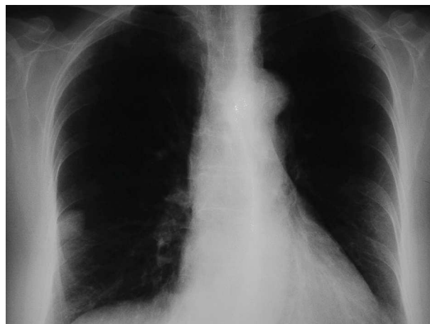
Figura 1. Radiografía de tórax.

Definimos con el término de NPS a una imagen radiológica única de mayor densidad, de forma más o menos redondeada, de bordes bien delimitados y rodeada de tejido