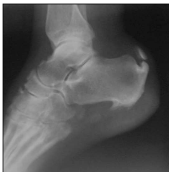
Fig. 1. Radiografía del pie izquierdo, vista lateral. Presencia de espolón calcáneo. Calcificación en la inserción del tendón de Aquiles con fragmento libre. Posible ruptura del tendón.

Es muy frecuente la asociación de espolones anteroinferior y posterior. Representaría de forma fehaciente la dirección de las tracciones en el sistema aquileo-calcáneo-plantar; en el 93 % de los casos es bilateral y simétrica.