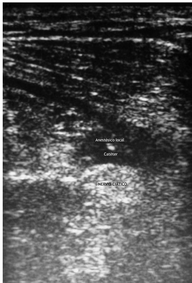
Figura 2 Imagen del catéter próximo al nervio ciático y de la difusión del anestésico local administrado a través del catéter.

segunda dosis de 10 ml de ropivacaína 0,75% a través del catéter durante 1 min, visualizando la difusión del anestésico local (fig. 2). Al finalizar la inyección de esta dosis la intensidad del dolor descendió a 20. En este momento se conectó al catéter una bomba PCA de ropivacaína 0,2% a un ritmo de perfusión basal de 5 ml/h, con posibilidad de bolos de 10 ml cada 30 min. Además, bajo un enfoque multimodal de la analgesia, se pautó metamizol 2 g intravenoso cada 6 h, con tramadol y cloruro mórfico como analgésicos de rescate. La analgesia se valoró, tanto en reposo como con el movimiento de la extremidad amputada, a las 8, 16, 24, 36, 48 y 72 h tras la colocación del catéter en una EVN de 0 a 100: a las 8 h se valoró como 20, tanto en reposo como en movimiento; a las 16 y 24 h fue valorada como 0 en reposo y 10 con el movimiento de la extremidad; a las 36, 48 y 72 h el dolor se valoró como 0 tanto en reposo como con el movimiento. Durante las primeras 72 h tras la colocación del catéter el paciente recibió curas del muñón que fueron bien toleradas y que no precisaron la administración de analgesia adicional. Durante el tiempo que se mantuvo el catéter, el paciente no presentó ningún efecto adverso atribuible a la pauta analgésica, recuperó el ritmo sueño-vigilia y presentó un elevado grado de satisfacción con el tratamiento analgésico. A las 72 h el catéter se retiró sin incidencias.