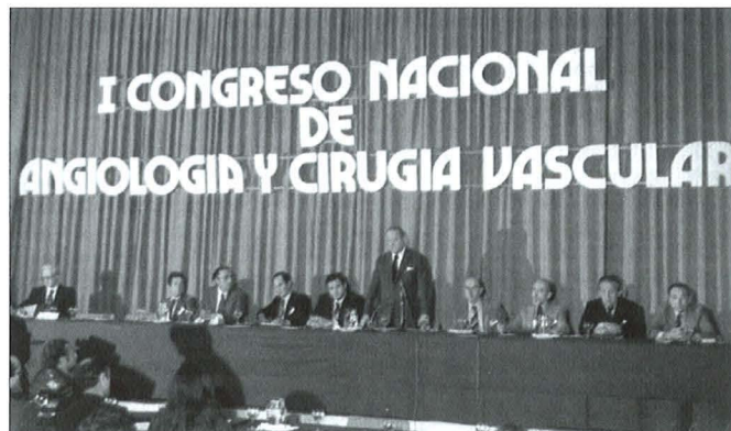
Figura 1. I Congreso Nacional de Angiología y Cirugía Vascular.

Por lo tanto, ahora celebramos los 50 años de existencia de la SEACV (aniversario 'de oro'). En este tiempo, la Sociedad ha recorrido un largo camino, propiciando que en la actualidad el número de socios esté muy próximo a los 1.000, lo que indica el elevado índice de aceptación de la Sociedad entre los angiólogos y cirujanos vasculares y, de ahí, el interés de la actual Junta Directiva (que recientemente ha cumplido sus primeros 100 días) en continuar en esta línea ascendente para conseguir una Sociedad aún más potente que pueda ser escuchada en todos los foros. No hay duda de que el trabajo de muchos socios y, por supuesto, de anteriores directivas ha facilitado esta progresión. Por otra parte, los medios económi-