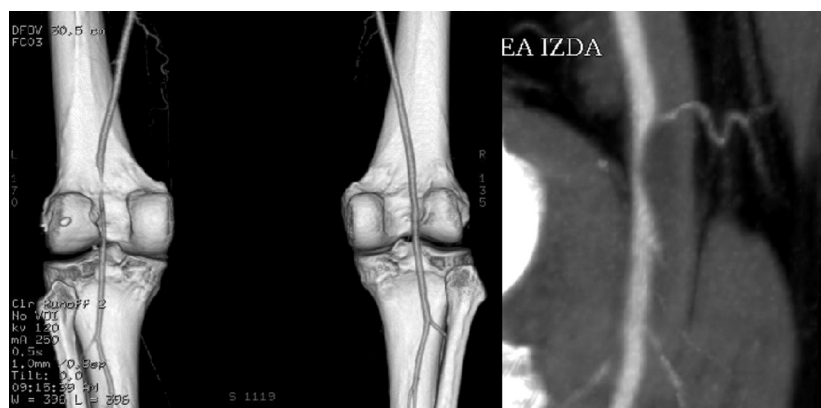
Figura 2 Imagen diagnóstica de quiste adventicial localizado en segunda porción de poplitea en miembro inferior izquierdo en varón de 51 años con claudicación gemelar izquierda de un mes de evolución a 100 m.

Hecho similar ocurre al realizar una angioplastia transluminal simple. El resultado inmediato suele ser muy bueno,