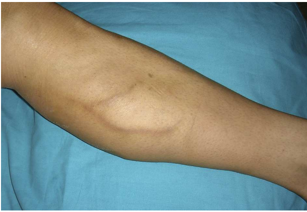
Figura 1 Flebitis química tras escleroterapia.

protrombina 20210 A, homocigosis para MTHFR, hipertrigliceridemia e hiperhomocisteinemia.