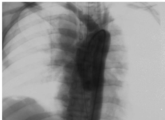
Figura 1 Aortografía: falso aneurisma en la arteria innominada apreciándose la línea de rotura en su base y la de retracción distal de las capas internas.

Operación: esternotomía prolongada por delante del esternocleidomastoideo derecho. Heparinización, canulación de las arterias braquial derecha y femoral izquierda