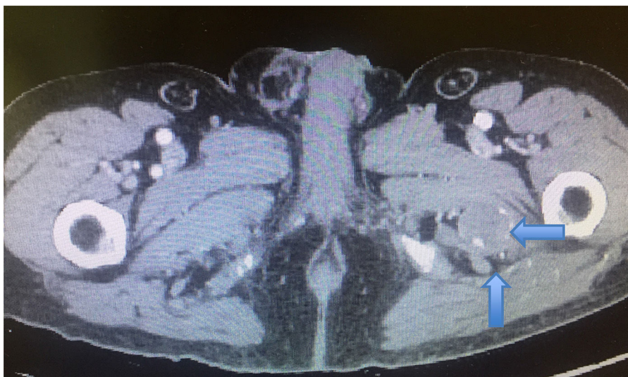
Figura 1 Aneurisma arteria ciática persistente.

lesionados, pero TP que le llega al pie, y se objetiva un aneurisma de la arteria ciática persistente trombosado y edematización del músculo isquiotibial, compatible con un traumatismo, y compresión del nervio ciático (figs. 1 y 2). Se realizó un ecocardiograma que resultó normal.