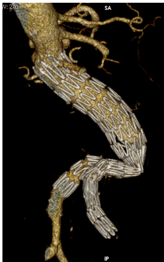
Figura 2 Se observa un caso de trombosis por migración craneal del sellado distal como consecuencia de la remodelación del saco aneurismático.