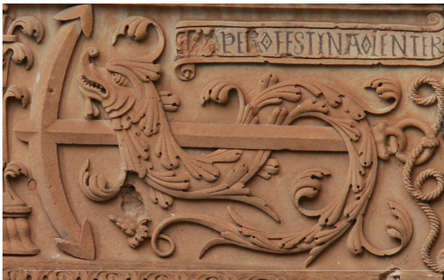
Figura 1 Patio de la Universidad de Salamanca. Enigmas (s. XVI). Sexto enigma: Festina lente (apresúrate despacio). El ancla sobre el delfín es idea de contraposición, de lo lento (ancla) y lo rápido (delfín).