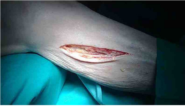
Figura 4 – Exposición del paquete vasculo-nervioso safeno.

y solución que en los casos anteriores) cutánea, fascia, músculo de la región poplítea y periadventicial de vena safena proximal, lo que permitió la exéresis completa de la misma; infiltramos la celda peronea mediante un rodete en el cuello del peroné y directo sobre el territorio a explorar. Tras hacer la anastomosis proximal no tuvimos problemas para tunelizar el injerto hacia el compartimento lateral. Igualmente usamos heparina local, no fue preciso revertir la heparina y el tiempo medio de intervención fue de 102 \pm 10 min.