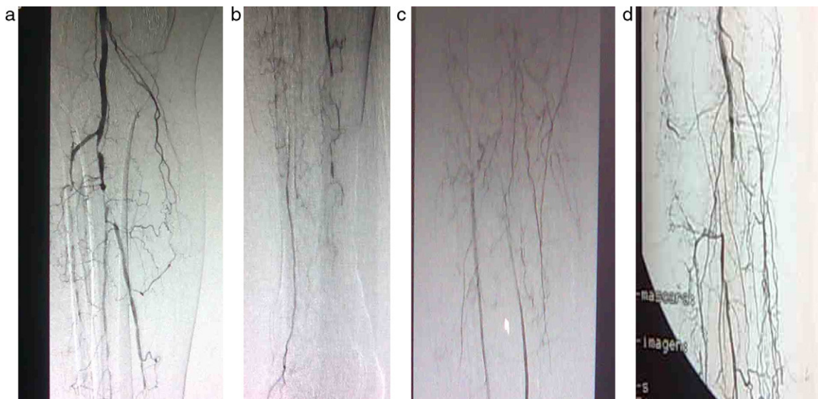
Figura 1 – a-d) Arteriografías preoperatorias.

En 5 pacientes se realizó by pass femorotibial posterior: infiltramos anestésico local (mepivacaína 2% 10 ml diluido en 10 ml de suero fisiológico 0,9%) a 1 cm por debajo del pliegue inguinal, paralelo al mismo, lo que nos permite abordaje directo de la vena safena mayor a nivel del cayado, así como infiltración de fascia muscular para exposición de vasos femorales (fig. 2a y b) (similar a cuando realizamos trombec-tomía ilio-femoral); el promedio de agente anestésico utilizado por paciente es 250-300 mg de mepivacaína 13 en un volumen total de 120 ml. De este modo realizamos crosectomía femorocrural con ligadura del cayado de la safena mayor y colaterales y realizamos sutura directa sobre arteria femoral común o superficial (asociar endarterectomía femoral si