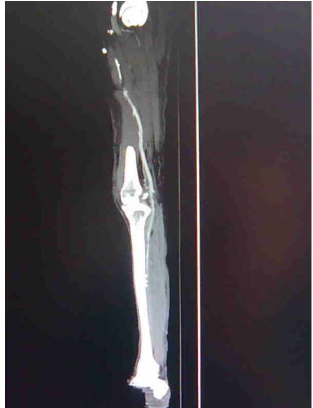
Figura 5 – Control angiográfico posterior que muestra permeabilidad del injerto.

1) Atendemos a pacientes cada vez con mayor comorbilidad, lo que los hace de alto riesgo tanto anestésico como quirúrgico. Una cuestión extensamente debatida es qué técnica anestésica es mejor para el paciente que va a ser sometido a revascularización de miembros inferiores, cuestión aún por aclarar 2,3 . En cualquier caso, tanto la raquídea como la general presentan riesgos no despreciables para cirujanos y anestesiólogos 2-4,6 : riesgo de hipotensión, bloqueo