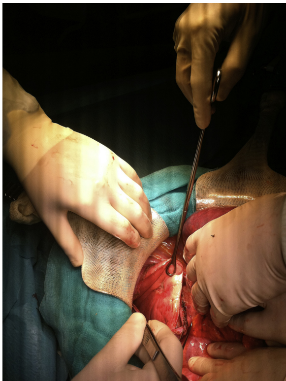
Figura 1 – Tracción de la base pulmonar e identificación de la metástasis.

traccionando de la base pulmonar hacia la cavidad abdominal (fig. 1). Una vez localizada la lesión se realizó resección de la misma utilizando un dispositivo de corte y grapado automático (fig. 2). Posteriormente, el diafragma fue cerrado mediante una sutura continua de material absorbible dejando un drenaje en el espacio pleural. Previo a su cierre, otros 2 drenajes fueron colocados en la cavidad abdominal.