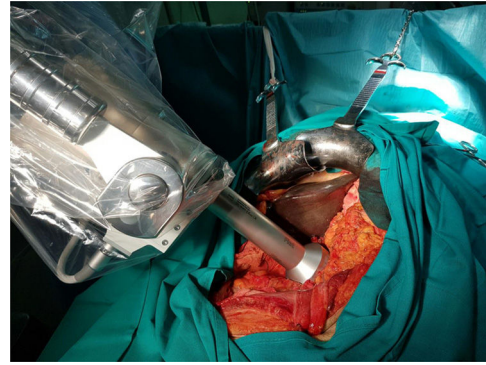
Figura 1 – Aplicación del dispositivo Intrabeam® para IORT en el cáncer de páncreas.