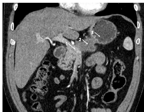
Figura 1 – Imagen radiológica donde se observa la infiltración vascular.

En nuestro paciente, el uso del ligamento falciforme como injerto permitió la reconstrucción del defecto venoso de una