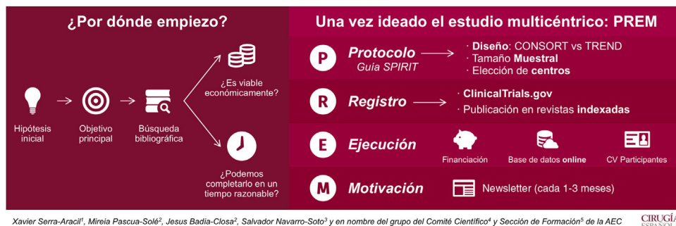
Figura 3 – Resumen gráfico.