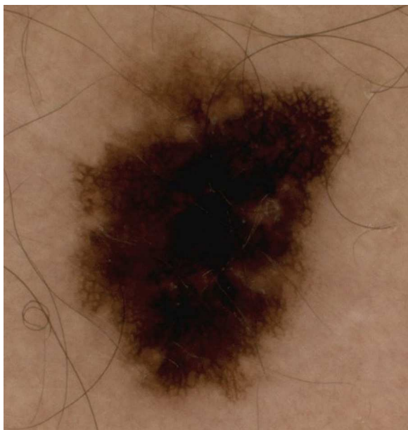
Figura 5 Red de pigmento atípica y asimetría en 2 ejes en un melanoma invasivo menor de 1 mm de espesor.

La extirpación de toda lesión pigmentada aun en sujetos con riesgo por sus características físicas (evidencia de fotodaño, fenotipo I-II, piel tipos 1 a 3) en función únicamente de la evaluación clínica lleva a una tasa elevada de falsos positivos y a procedimientos quirúrgicos y estrés innecesarios 5,6 .