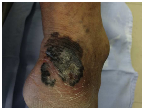
Figura 1 Melanoma invasivo, grueso y ulcerado, clasificado como pT4B; la evidencia clínica es suficiente para el diagnóstico.

En México, la mayoría de los melanomas cutáneos históricamente han sido diagnosticados en etapas localmente avanzadas 2,3 , con datos no solo dermatoscópicos sino clínicos macroscópicos evidentes de la neoplasia como ulceración, sangrado y fase de crecimiento vertical (fig. 1); en estos pacientes la dermatoscopia no ofrece más datos para el diagnóstico de melanoma cutáneo; sin embargo, en aquellos pacientes que se presentan con lesiones incipientes, si bien son la minoría, la decisión de escindirla o no depende de