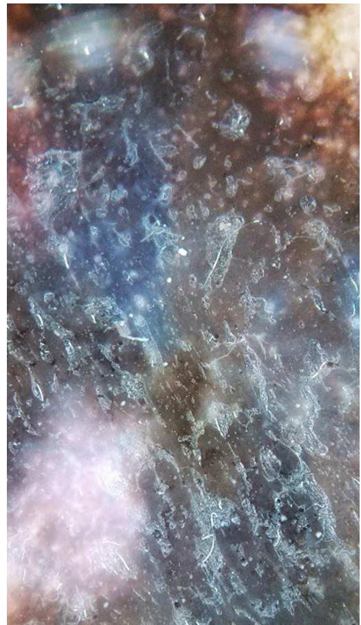
Figura 4 El velo azul tenue de esta lesión además de la presencia de más de 3 colores y área de falta de pigmento corresponden a un melanoma invasivo mayor de 1 mm de espesor.

le compara con la evaluación clínica «al ojo desnudo» 1 ; permite identificar hallazgos microscópicos que pasarían desapercibidos en el análisis clínico y también lesiones no solo con alta sospecha de melanoma sino con un nivel de invasión mayor a una lesión superficial lo cual permite al clínico decidir el tratamiento expedito de este tipo de lesiones.