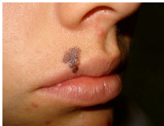
Figura 2 Lesión pigmentada que clínicamente hace dudar si se trata o no de un melanoma; correspondió a un melanoma in situ .

Los hallazgos dermatoscópicos analizados fueron: asimetría en 2 ejes, asociación de colores, áreas con falta de pigmento, puntos irregulares y atípicos de pigmento, red de pigmento atípica, pseudópodos, presencia de velo azul, ulceración y eritema periférico (anillo rosa).