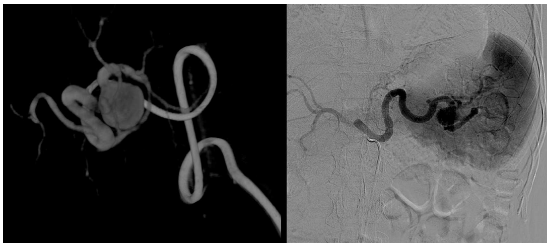
Figura 1 Estudio angiográfico donde se confirma dilatación de aspecto fusiforme localizado en el tercio distal de la arteria esplénica.

en el tercio proximal, se realizará aneurismectomía; en el tercio medio se prefiere la exclusión aneurismática, así como la esplenoneurismectomía si se localiza en el tercio distal.