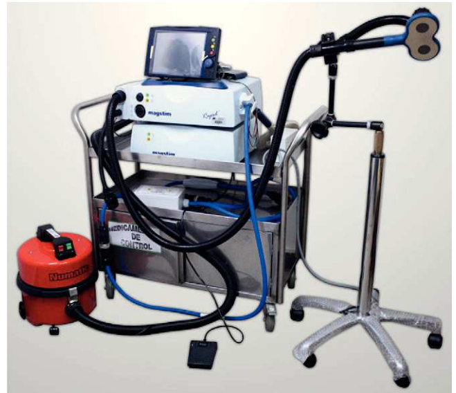
Figura 1 – Equipo de estimulación magnética transcraneal.

La bobina de estimulación consiste en un material de hilo de cobre completamente aislado recubierto con un molde de plástico 1 . Con la bobina activa, el campo magnético penetra fácilmente piel, cráneo y meninges e induce una corriente eléctrica secundaria en el tejido cerebral, orientada en un plano paralelo a la superficie cortical cuando se sitúa la bobina tangencialmente al cráneo, de tal manera que la estimulación se hace sobre los elementos neuronales de la corteza que tienen orientación horizontal y no transversal. Su acción neuromoduladora es, en su gran mayoría, transináptica e indirecta, y actúa cerca del cono axónico de las células pirami-