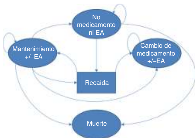
Figura 1 – Modelo.

Entre los demás antipsicóticos, el más efectivo fue el aripiprazol con 2,60 años antes de modificar el tratamiento, sin embargo su razón de costo efectividad incremental frente a la siguiente alternativa en términos de efectividad, el haloperidol, fue de $606.069.242, muy superior a tres veces el producto interno bruto (PIB) per cápita ($14.287.805) 51 . Con excepción del aripiprazol, el haloperidol reportó mayor efectividad y menores costos frente a los demás antipsicóticos que no están en el grupo de primera línea (tabla 1).