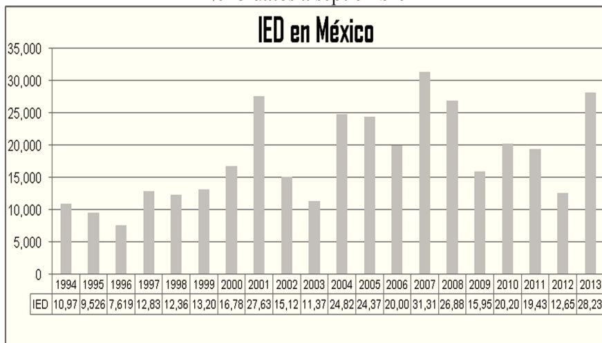
Figura 3. Flujos de IED en México después de la LIE de 1993, 2013 datos a septiembre