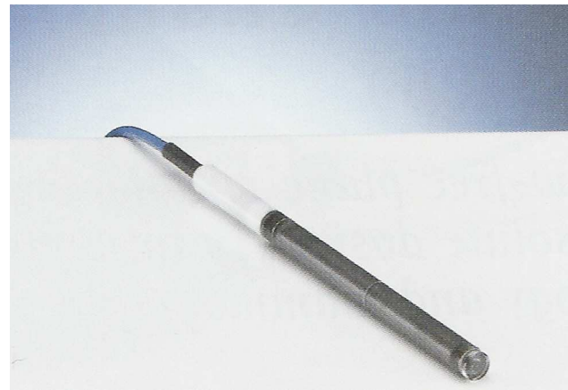
Figura 2 Cámara de ionización tipo lápiz.

siglas en inglés: Computed Tomography Dose Index ), que ha sido definido como: