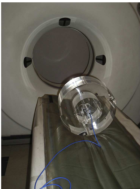
Figura 4 Fantoma abdominal y craneal de acrílico (PMMA) donde puede observarse la cámara de ionización colocada en el orificio central.

El CTDI puede calcularse tanto en aire como en el interior de un fantoma de acrílico (polimetilmetacrilato [PMMA]). Estos habitualmente son cilíndricos (aunque también hay elípticos y antropomorfos) y tienen alturas de entre 15 y 20 cm, y diámetros de 16 (maniquí representativo para cabeza) o 32 cm (maniquí representativo del cuerpo estándar). Siempre llevan un alojamiento central para la cámara lápiz y al menos cuatro alojamientos periféricos, perforados a 1 cm de la superficie exterior del cilindro y situados regularmente a 90° entre sí (fig. 4).