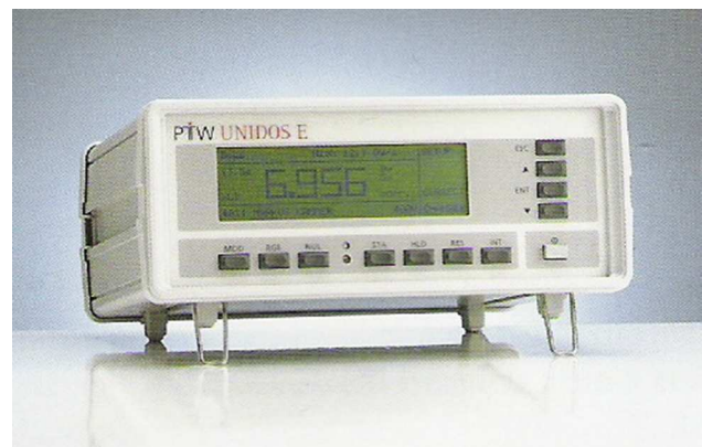
Figura 3 Electrómetro - Dosímetro.

Para las mediciones de dosis, se utilizan maniqués (fantomas) de acrílico compacto. Cuando la cámara lápiz se coloca en aire o en el interior de un fantoma, en posición paralela al eje z de barrido del equipo, y se efectúa un corte por el plano que pasa por el centro de la cámara, esta recoge