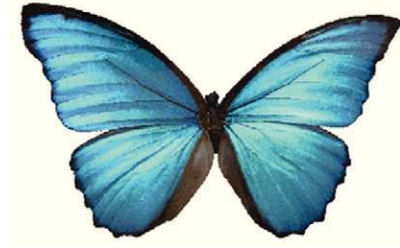
Imagen de una mariposa con sus dos pares de alas membranosas extendidas que evidencia similitud con las imágenes de la tomografía de columna lumbar.

TC multicorte plano coronal y reconstrucción en ventana ósea 3D donde se observa la vértebra transicional con acúñamiento medial, dando el aspecto de alas de mariposa.